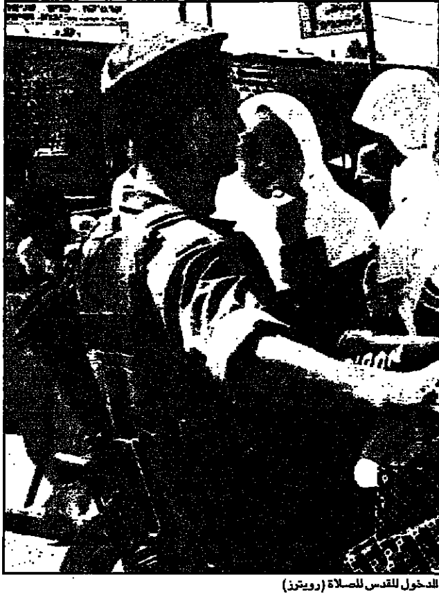
جندي اسرئائلي يمنح فلسطينيات من الحلال للقدس للسلامة